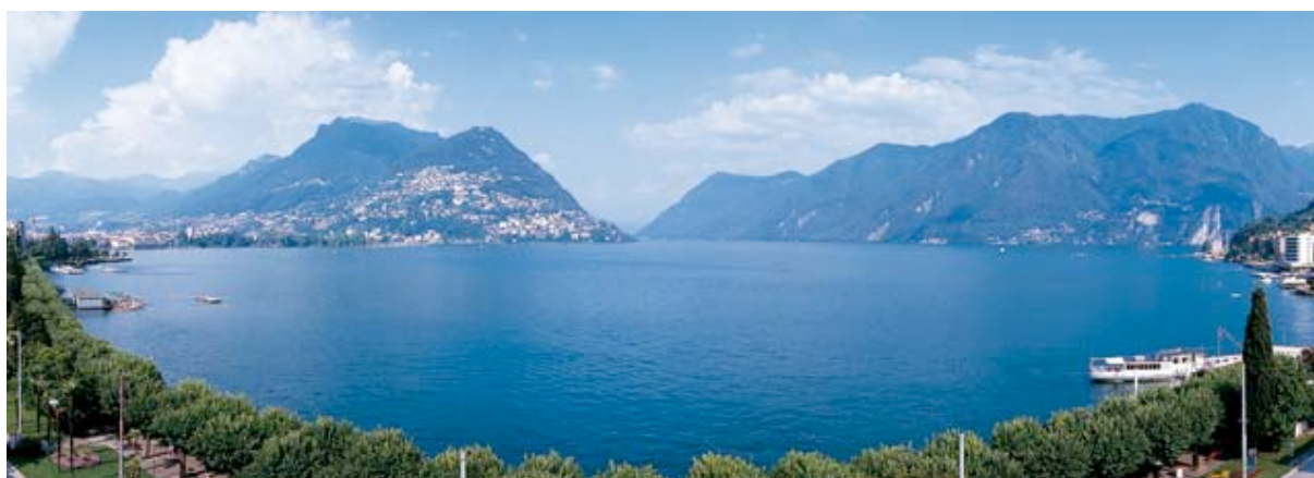
vista strategica dalla sala conferenze "La Panoramica"

Il Best Western Hotel Bellevue au Lac è un albergo tradizionale e familiare, situato sul lungolago di Lugano, a pochi minuti a piedi dal centro storico della città. L'albergo dispone di 3 nuove Suite, 10 Junior Suite e 52 camere Deluxe e Standard tra doppie e singole, arredate modernamente con gusto e allegria e dotate di un balcone con bella vista sul lago e montagne. Tutte le camere dispongono di accesso gratuito ad internet ad alta velocità (HSIA, con cavo), nonché di un nuovo sistema di aria condizionata.